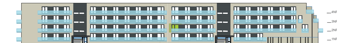
Severní pohled na dům / Building View - north side